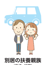
別居の扶養親族 (息子・娘等)