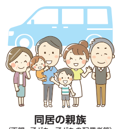
同居の親族 (両親・子ども・子どもの配偶者等)